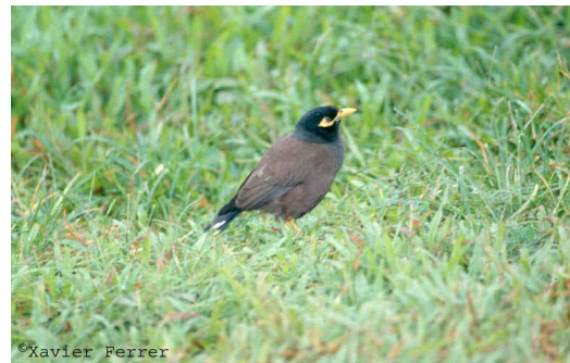
Acridotheres tristis

La distinción entre las categorías C y E depende de cada taxón en particular, aunque el GAE ha establecido un protocolo para asignar las especies a una u otra (Tabla 2). En caso de duda, debe mantenerse la categoría E hasta que existan pruebas para incluirla en la C.