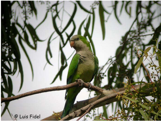
Myiopsitta monachus

La lista ha sido revisada a nivel taxonómico siguiendo las recomendaciones del Comité Taxonómico de la AERC (AERC TAC 2003). Entre otras cosas, se han reordenado los taxones, manteniendo la propuesta de la AERC de anteponer, después de las Ratites, las Galloanserae a las Neoaves, y se han reestructurado estos tres bloques a nivel interno siguiendo a Clements (2000). Se han añadido, además, las subespecies citadas cuando estas han sido determinadas.