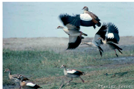
Alopochen aegyptiaca

solamente conocemos la observación de Psittacula krameri , no se detallan por ahora las categorías que les corresponden en la tabla.