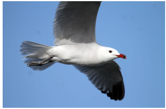
Gavota audouin adulta