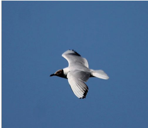
Gaviota reidora adulta