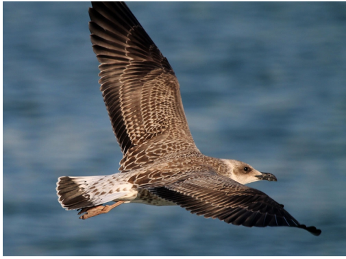
Gaviota patiamarilla joven