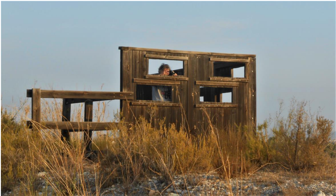
Otro observatorio margen de Borriana.26/08/2019