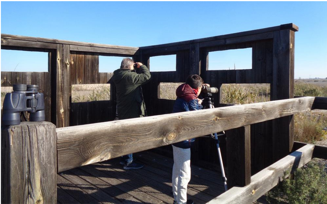
Mismo observatorio 05/01/2019