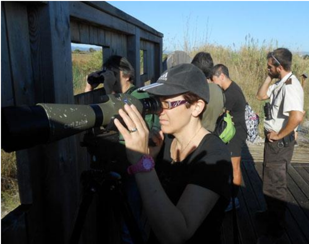
Mismo observatorio con gente que puede espantar a las aves y el objetivo esfumarse. 03/11/2012