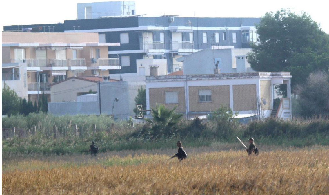
Cazadores cerca de las viviendas. Pou Nules