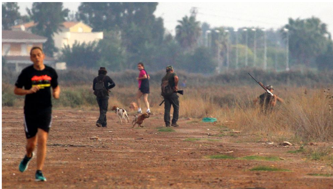
Cazadores y perros de caza por la pista que utiliza la gente para hacer deporte. Pou Nules