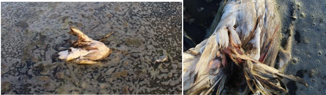
Flamenco muerto 23/11/2017. Pou de Nules.