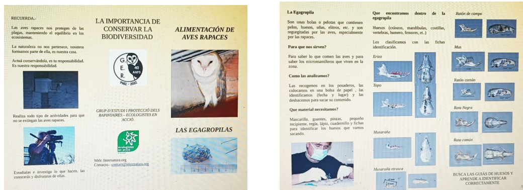
Tríptico utilizado en los distintos talleres de protección de las lechuzas.

- Edición de material para la difusión de aspectos importantes en la conservación y alimentación de las aves rapaces.