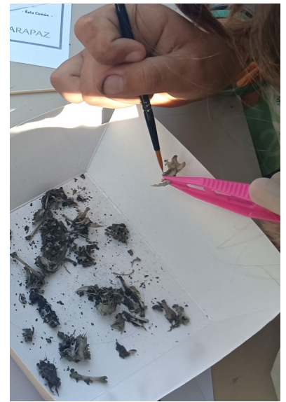
Algunas egagrópilas usadas en el taller