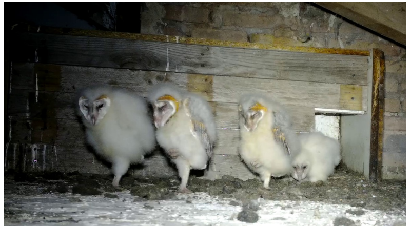
Una de las cajas colocadas en una alquería abandonada usada por lechuzas. Otra caja con 4 pollos nacidos.