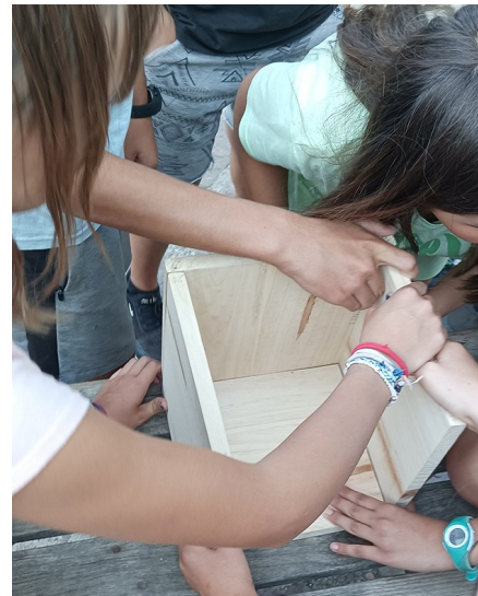
Algunos momentos del taller con los niños, construyendo cajas nido para rapaces nocturnas