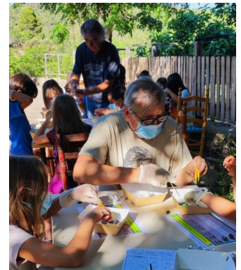
Miembros del GER-EA en uno de los talleres.