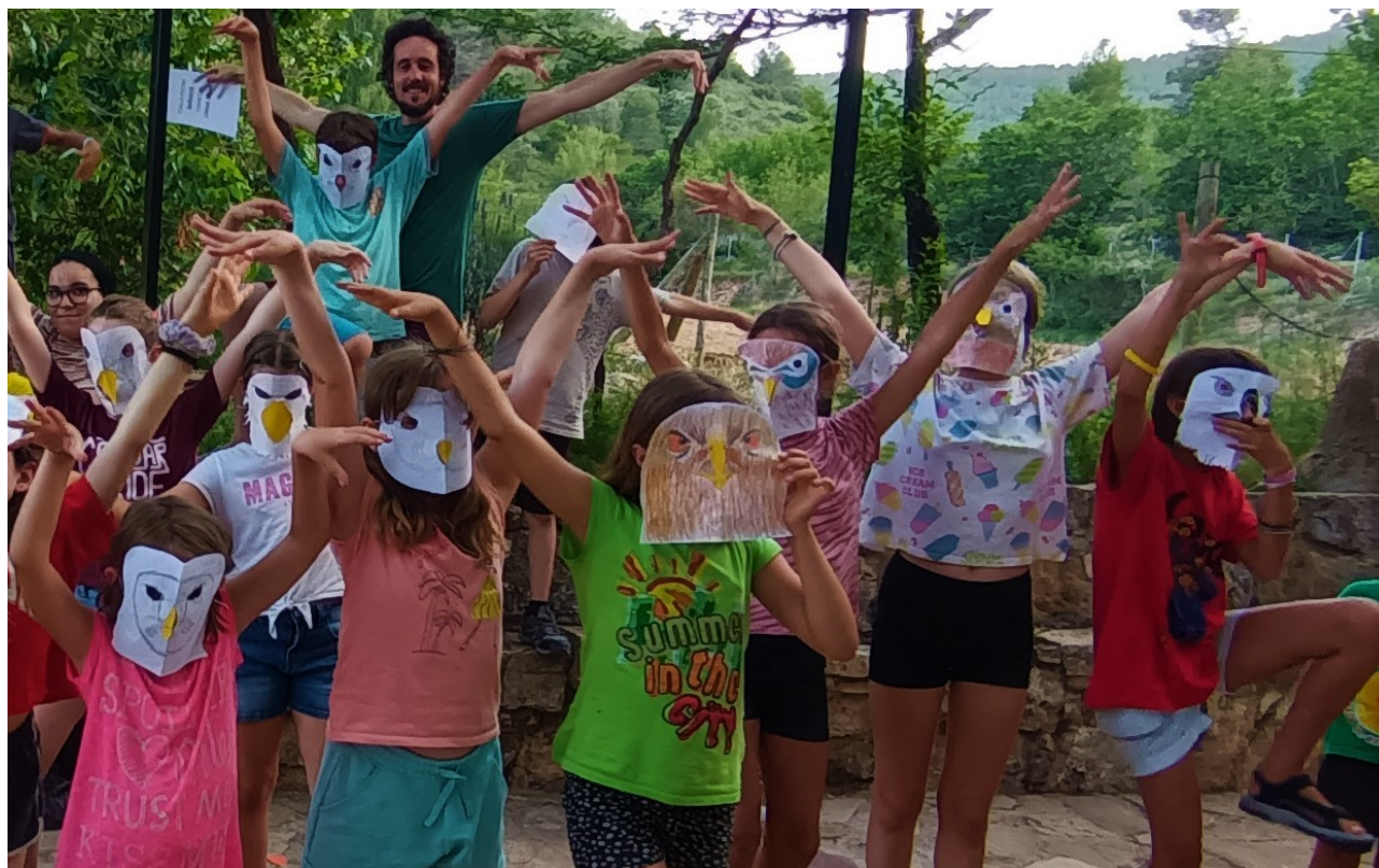
Conservar las aves rapaces divirtiéndote, es lo más efectivo.

Seguimos en el concepto que es imprescindible “conocer para proteger” .